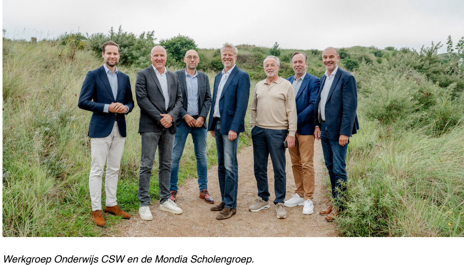
Werkgroep Onderwijs CSW en de Mondia Scholengroep.

Voor het verdere verloop van het proces verwijzen we naar de planning die ook in deze nieuwsbrief is opgenomen. In dat vervolg o.a. tijd en ruimte voor een volgende inloopessie voor geïnteresseerde collega's en voor het standaard geprogrammeerde overleg met de vakbonden. Omdat het proces naar een samenwerkingsbestuur op geen enkele wijze zal en kan leiden tot een verlies van werkgelegenheid, zien we de gesprekken met het CNV en de Aob met vertrouwen tegemoet. We gaan ervan uit dat we met alle medewerkers in vaste dienst (en veel van de collega's in tijdelijke dienst) de overstap zullen maken.